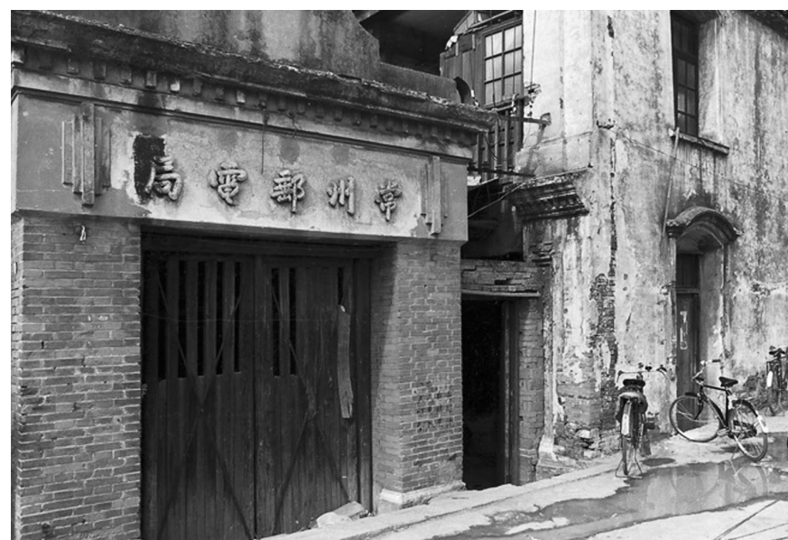
早期的常州邮电局